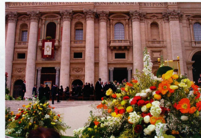
Nelle immagini: foto scattate in Vaticano durante la preparazione per cerimonia di insediamento di Papa Benedetto XVI

Intanto il numero di fiori utilizzati, offerti dalla Regione Liguria, dalla Provincia di Imperia e dal Comune di Sanremo, è cresciuto in continuazione in quanto ne è stata richiesta la presenza anche per la cerimonia in "San Paolo fuori le Mura". Questa, a differenza di quanto molti pensano, è la basilica principale della città di Roma, in quanto San Pietro è situata nello Stato Vaticano, e proprio quella è stata la prima cerimonia che il Santo Padre, Vescovo di Roma, ha celebrato nel cuore della città eterna.