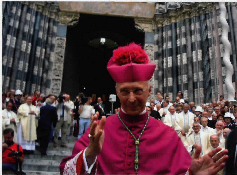
Nella foto: S. E. Mons. Angelo Bagnasco.

Monsignor Bagnasco, che siede sulla cattedra di San Siro dopo tre successori non genovesi del cardinale Siri, è nato a Ponteveico, nel bresciano, il 14 gennaio 1943, ma è figlio di una famiglia genovese sfollata in Lombardia a causa della guerra e a Genova ha studiato in Seminario, si è laureato in Filosofia ed è stato ordinato sacerdote. Monsignor Bagnasco, dal 20 giugno 2003 Arcivescovo Ordinario Militare d'Italia, e in precedenza arcivescovo di Pesaro, è segretario della Commissione Episcopale della Cei per la cultura e le comunicazioni sociali e dal 2001 è Presidente del Consiglio di Amministrazione del quotidiano L'Avvenire. A Genova è stato per molti anni vicario parrocchiale della Parrocchia di San Pietro e Santa Teresa del Bambino Gesù, docente di Metafisica e Ateismo alla sezione genovese della Facoltà Teologica dell'Italia Settentrionale, docente di italiano al liceo classico del Seminario, Assistente diocesano della Fuci, Direttore dell'Ufficio Catechistico della Diocesi e della Liguria, Preside dell'Istituto superiore di Scienze religiose, direttore dell'Opera Diocesana Apostolato Liturgico e Vicario Episcopale e Direttore Spirituale del Seminario Arcivescovile.