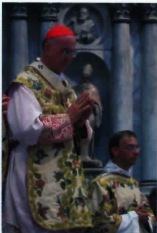
Nella foto: S. Em. Rev. Card. Tarciso Bertone.

Il forte legame che si è instaurato ha portato la cooperativa sanremese a essere nuovamente presente in un'altra data significativa per il Card. Bertone, quella della sua prima Messa nella Chiesa di Santa Maria Ausiliatrice a Roma